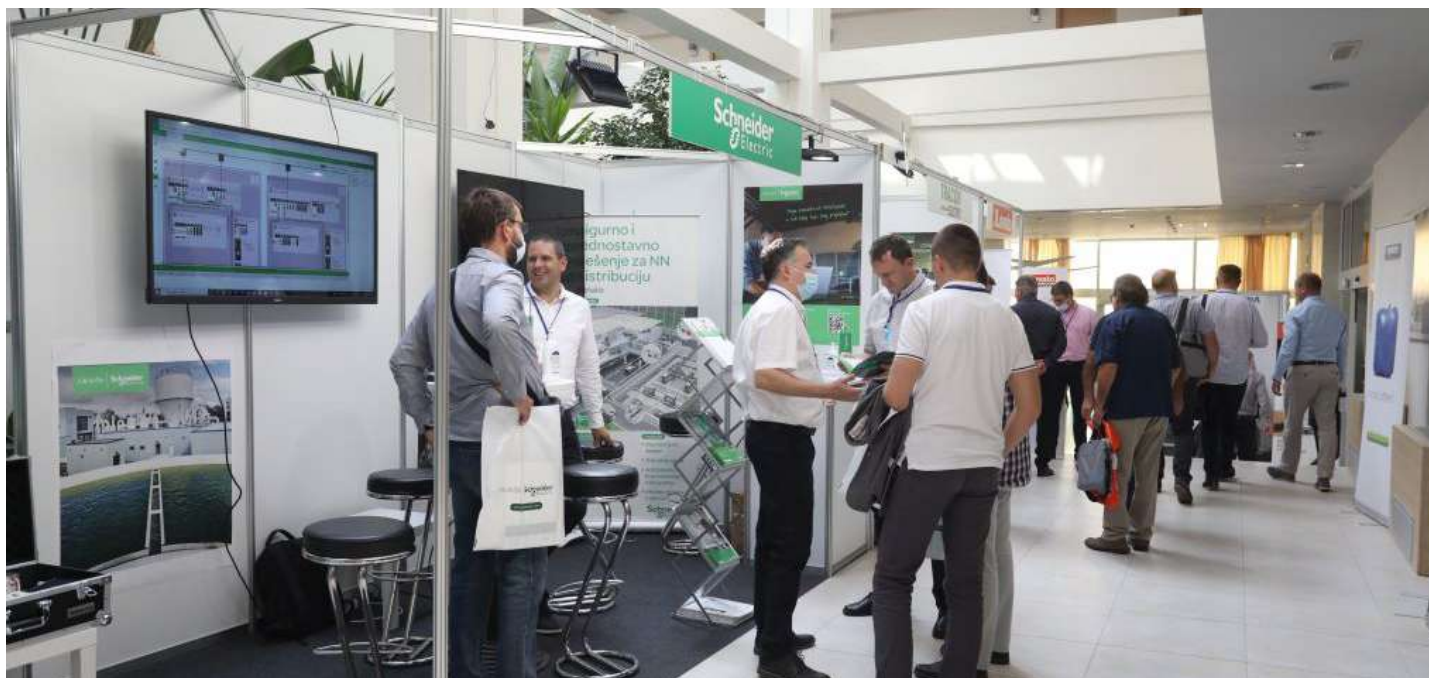
Sponzori i izlagači

digitalizaciju mreža i integraciju OIE unutar elektroenergetskog sustava, dok je drugi pokrenuo raspravu o aktualnim temama u HKIE-u – gdje smo danas i što želimo biti sutra.